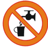
Joogiks kõlbmatu vesi