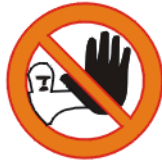
Kõrvalise isiku sisenemise keeld