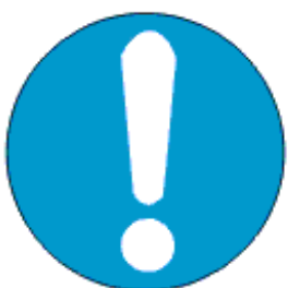
Üldine kohustusmärk (vajadusel kasutatakse koos mõne teise märgiga)