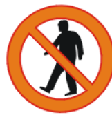
Jalakäija sisenemise keeld