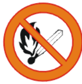
Suitsetamise ja lahtise tule kasutamise keeld