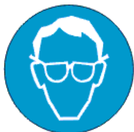
Kanna silmakaitse- vahendit

Kohustusmärgi olulised tunnused on ümar kuju, valge piltkiri sinisel taustal, kusjuures sinine osa moodustab vähemalt 50% märgi pindalast.