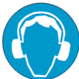
Kanna kuulmis- kaitsevahendit