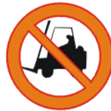
Veoki sissesõidu keeld