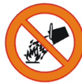
Veega kustutamise keeld