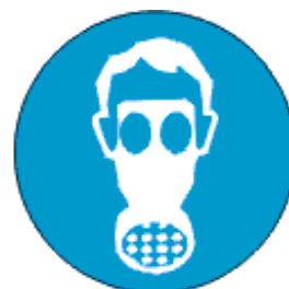
Kanna hingamisteede kaitsevahendit